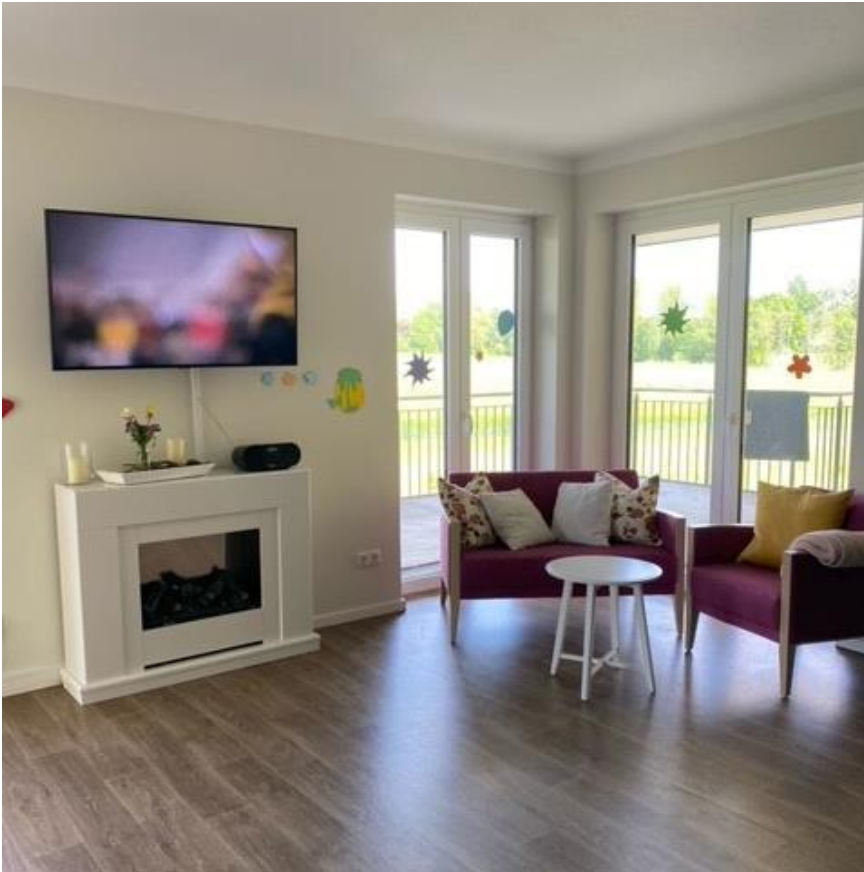
Wohnanlage in Immenhausen - Innenansicht