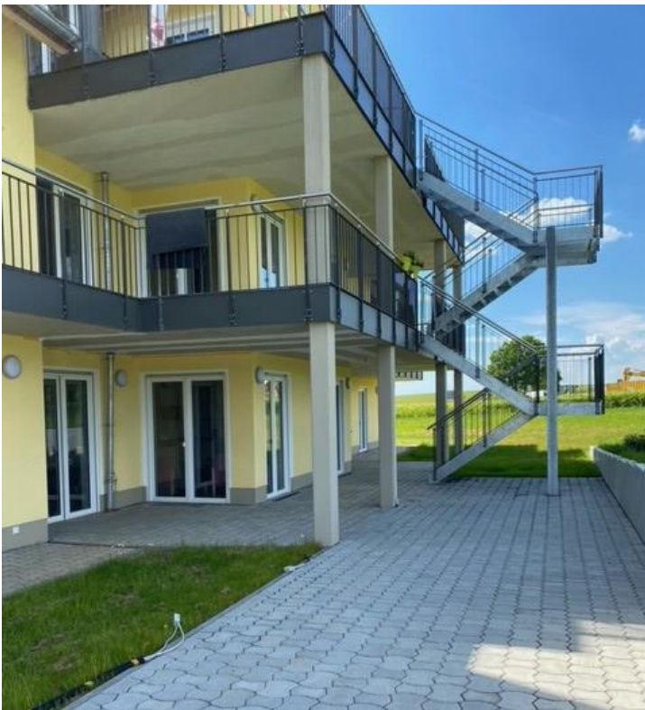
Wohnanlage in Immenhausen – Außenansicht