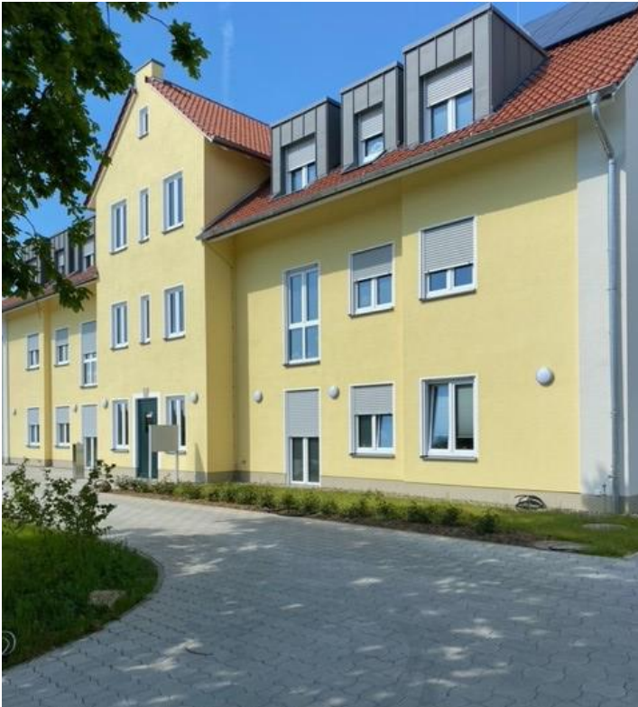
Wohnanlage in Immenhausen - Außenansicht